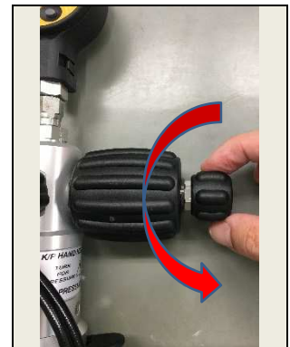
⑥大気開放バルブを反時計回りに回し、圧力を開放します