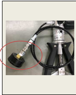
②検査対象の圧力計をクイックコネクタに取り付けます