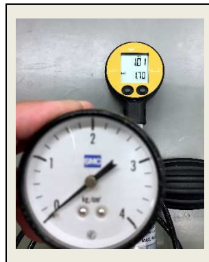
⑤基準用圧力計と検査対象の指示値を比較し合否判定します