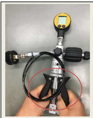
④ハンドルを握って圧力を発生させます。発生後の微調整も容易です