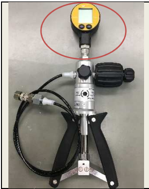
①ポンプ上部に基準用圧力計をセットします